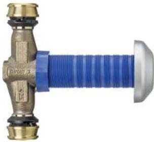
86505 - Optiflex-Flowpress-Unterputz-Geradsitzventil