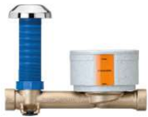
67113 - Rohbauset-Unterputz-Ventil-Garnitur, lange Ausführung, für Messkapsel Koax