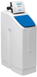
19051 - Wasserenthärter Aquapro-Vita Compact